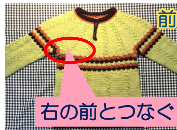
ひっくり返した図